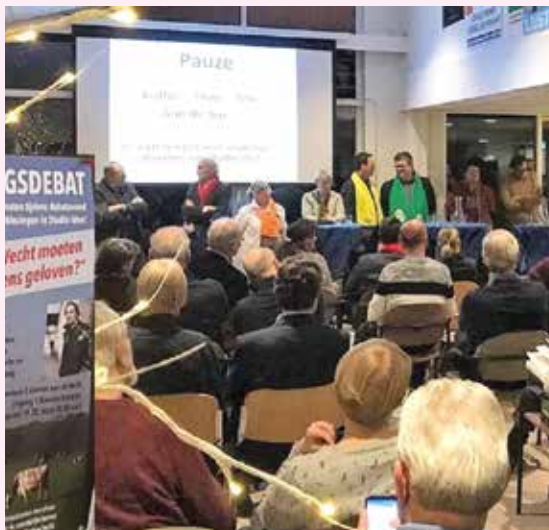
Dit jaar weer een verkiezingsdebat in Studio Idee...?