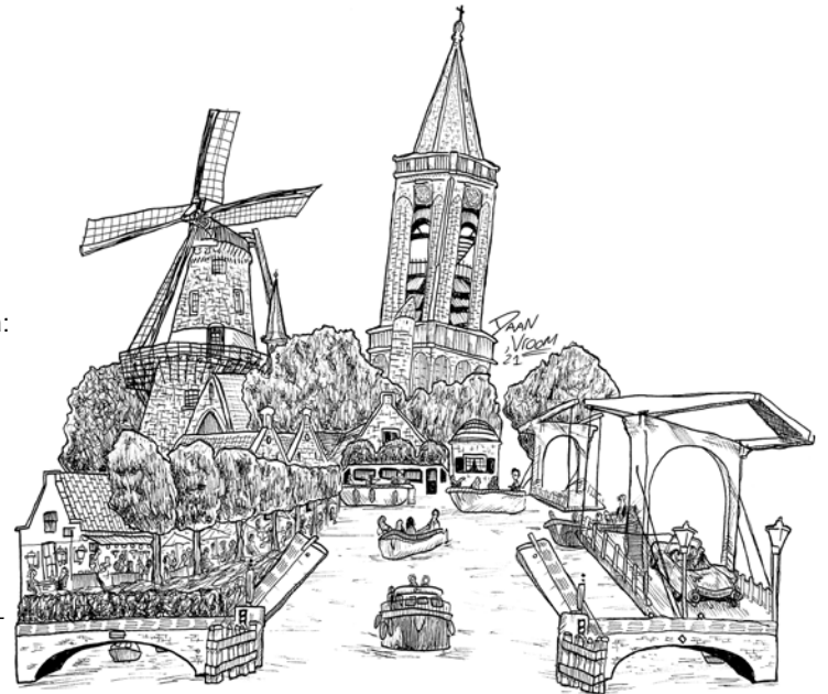
Tekening Daan Vroom