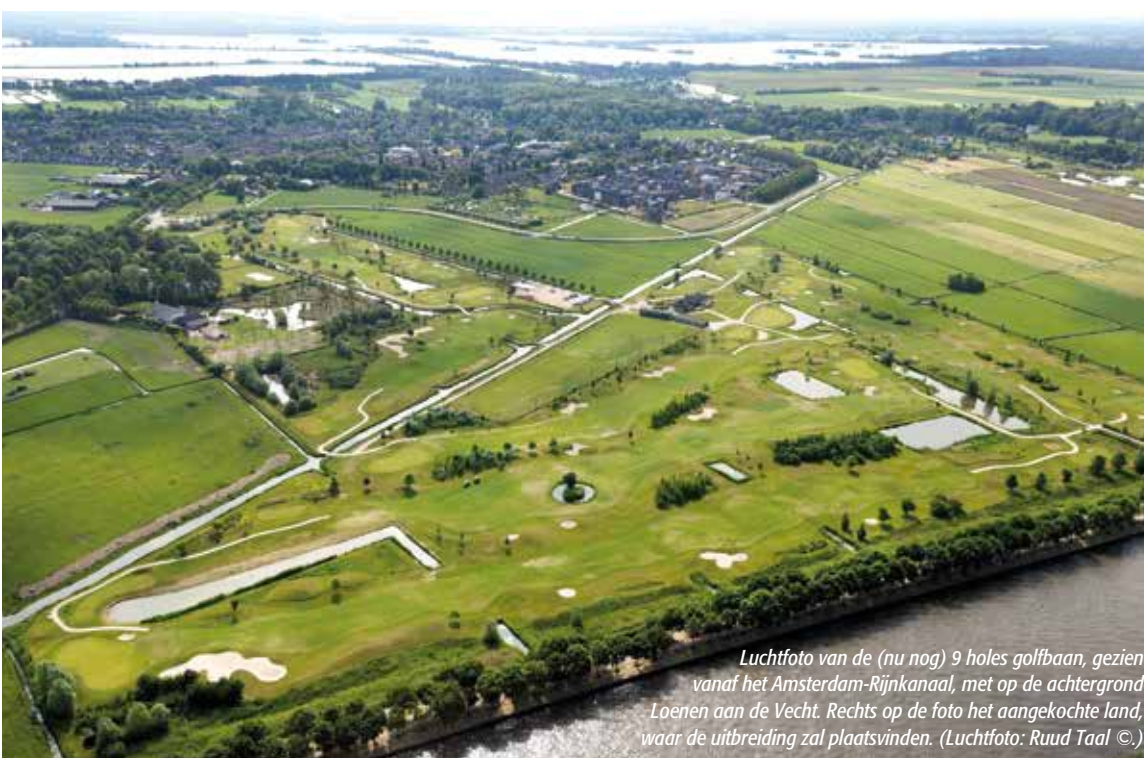
Luchtfoto van de (nu nog) 9 holes golfbaan, gezien vanaf het Amsterdam-Rijnkanaal, met op de achtergrond Loenen aan de Vecht. Rechts op de foto het aangekochte land, waar de uitbreiding zal plaatsvinden.

KLIMAATCONCEPT.NL - FLEVOLAAN 66 WEESP - 0294 255 406