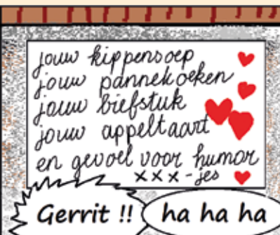
Strip van Red Mill