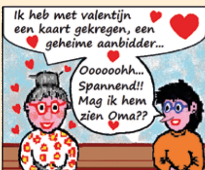
Oma en Ilona