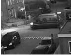
Het busje op een bewakingscamera.

Een inwonster van Vreeland heeft op Facebook melding gemaakt van een incident waar twee gemaskeerde mannen uit een donkerblauw busje sprongen om haar zoon aan te spreken en deels te achtervolgen. Zonder succes gelukkig. Men gaat uit van kwade bedoelingen. Het incident gebeurde op zaterdag 26 augustus 2023 ca. 21.15u op de Spoorlaan in Vreeland ter hoogte van de basisschool. De politie is geïnformeerd. Mensen die iets hebben gezien, worden opgeroepen om melding te doen bij de politie, tel. 0800-8844. Ingeval van nood of een acute verdachte situatie: altijd direct 112 bellen.