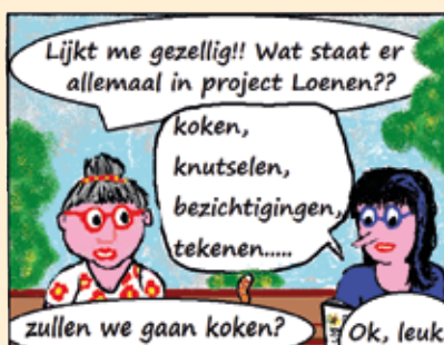
Strip van Red Mill