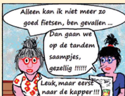
Strip van Red Mill