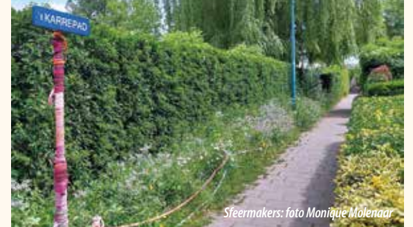
Steermakers: foto Monique Molenaar

En het is tenslotte ook heel duidelijk dat u dit stukje leest vanwege de kop. Zie hiervoor blz. 12 met de oproep om eens een filmpje te pakken in Loenen. In de kerk. Goede vakantie nog! HK