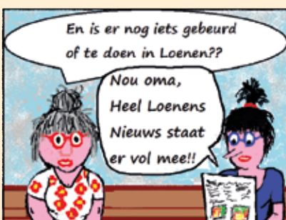
Oma en Ilona