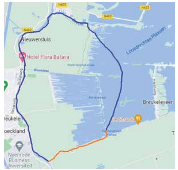
Rondje om de Zuid met in oranje het Tienhovens kanaal

De verkenning naar het Rondje om de Zuid maakt onderdeel uit van de aanpak Oostelijke Vechtplassen en wordt uitgevoerd door een zorgvuldig samengesteld projectteam