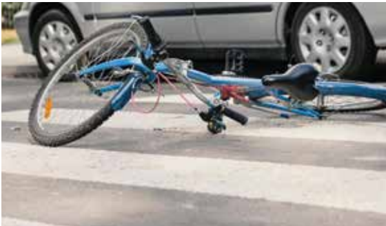
Verkeersongeval fiets auto

In de provincie Utrecht waren er vorig jaar 42 dodelijke slachtoffers te betreuren in het verkeer. Dat blijkt uit cijfers vandaag gepubliceerd door het CBS. Met name kwetsbare verkeersdeelnemers kwamen om in het verkeer. In de provincie Utrecht vielen de meeste verkeersdoden op gemeentelijke wegen, gevolgd door provinciale wegen, rijkswegen en wegen in het beheer van het waterschap.