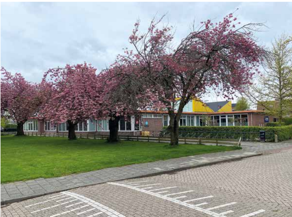
De Ludgerusschool, voorjaar 2023

Om de kunstzinnige ontwikkeling van de kinderen te stimuleren hangt elke maand een ander kunstwerk van de Kunstuitleen in de schoolgang. Creatieve en sociale vaardigheden worden onder andere gestimuleerd door de maandsluiting, waarin kinderen aan elkaar kunnen laten zien waar zij de laatste periode mee bezig zijn geweest. Nieuwe kinderen worden hier ook op een leuke wijze voorgesteld.